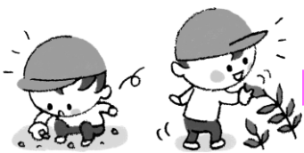
⑤しゃがむ・立ち上がる

はいはいで階段を上っていた子も、立って1段ずつ上がりはじめます。それから体重移動が少しずつスムーズになり、次第に足を交互に出して上がるようになります。でも、同じように下りるにはもう少し先です。急がず見守ってあげましょう。