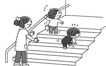
③階段を上る・下りる

歩行が安定してきて、段差がある場所や水たまりなど、いろいろな所を歩こうとします。安全に気を付けて、子どもの「歩きたい」を応援したいですね。