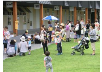
昨年の夏祭りの様子です(*^_^*)