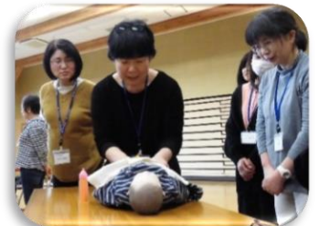
紫波町ファミリー・サポート・センター