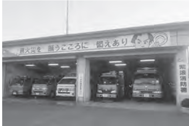
移転・新築が待たれる消防署

町長の回答: 町の広報やホームページ、懇談会... 財政状況の公開、自治... 会の集会で説明をして... いる。今後も増やして... いきたい。