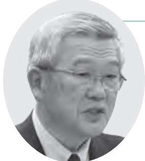
たかぎよしたか 議員 鷹木嘉孝