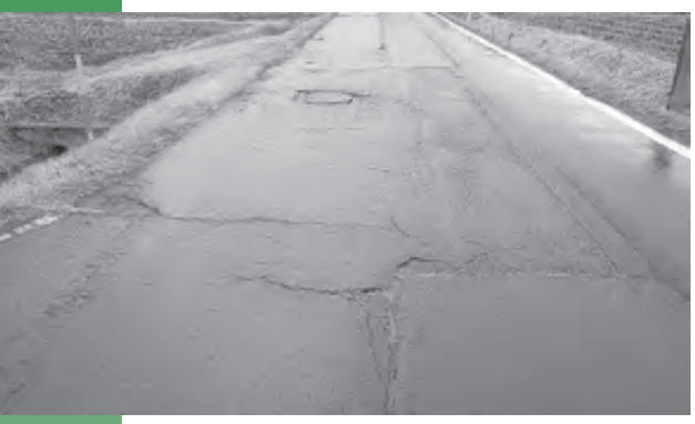
不陸がみられる道路

町長の回答: 関係者と協議をし... ながら、被害が大... きい箇所から対策を講... じ被害軽減に努めてい... る。