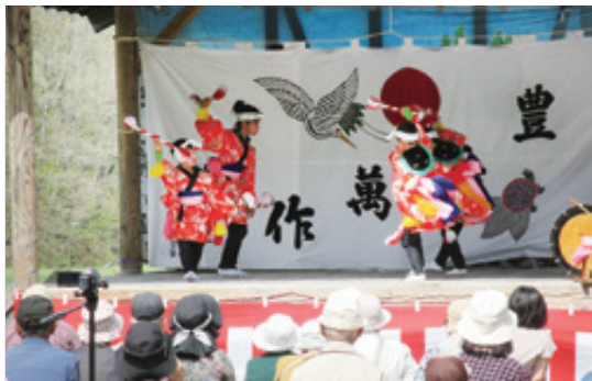
国指定山屋の田植踊り